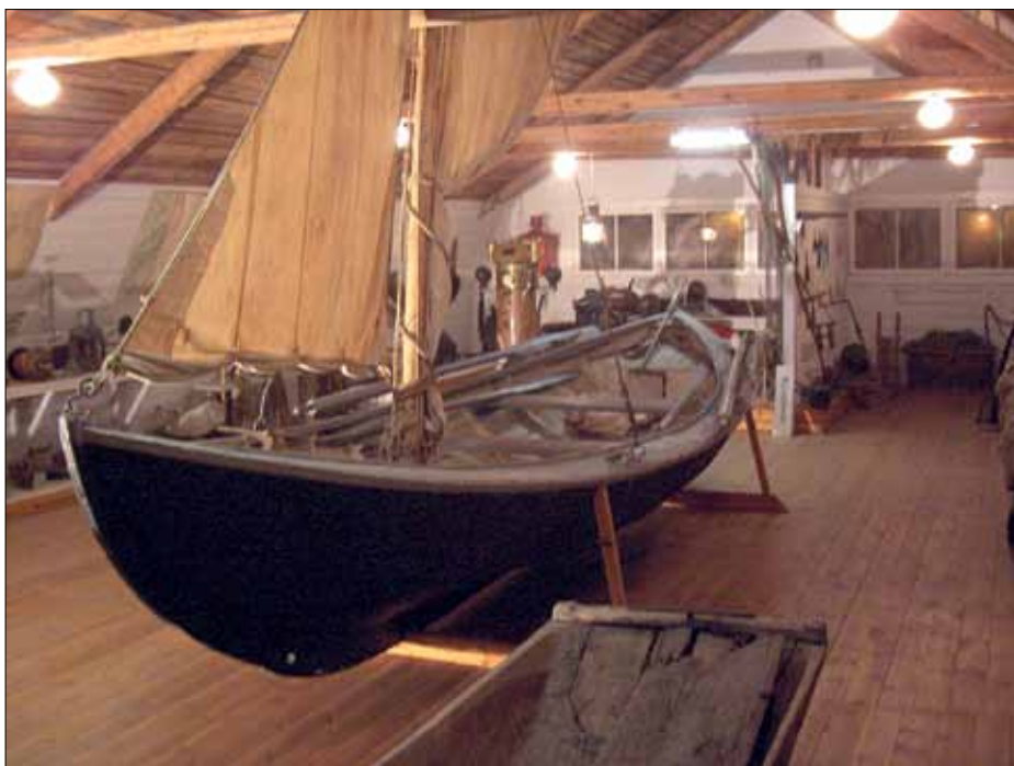
Stranda Hembygdsmuseum i Mönsterås har även en hel del sjöfartsminnen.

Timmernabben är ett typiskt samhälle för smålandskusten. Här fanns under 1800-talet flera sågverk, varv, rederier, och en livlig sjöfart med jordens alla hav som seglationsområde. I korsvirkeshuset finns en mindre men mycket illustrativ samling