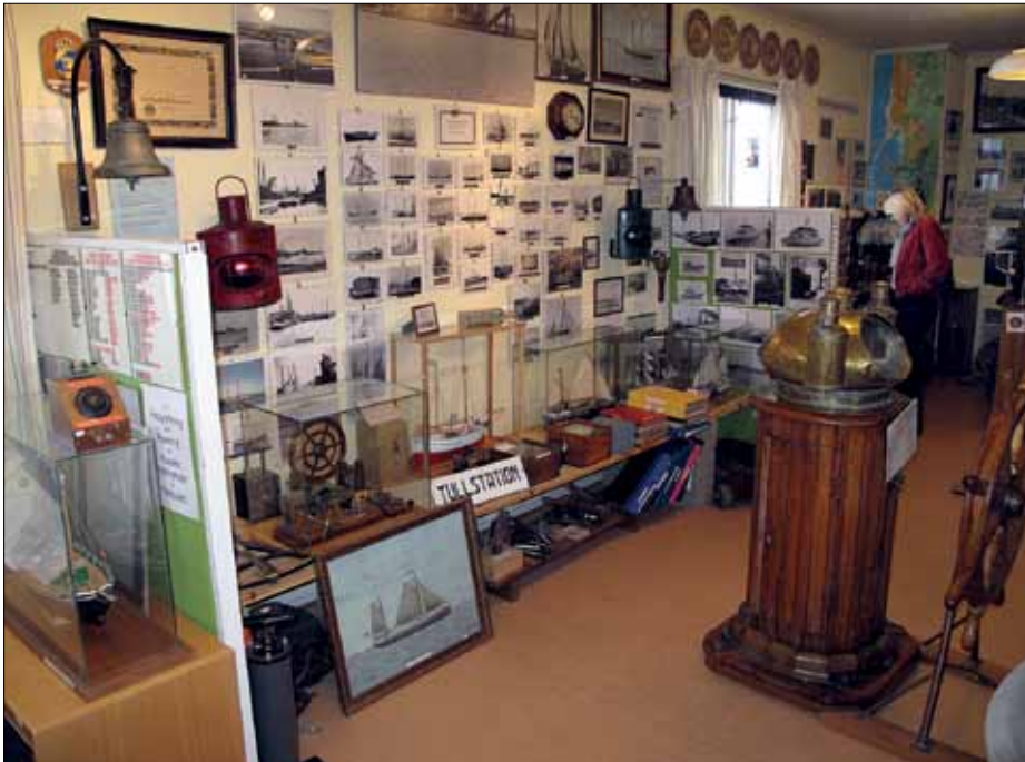
I Degerhamn kan man frossa i bilder från cementfarten.