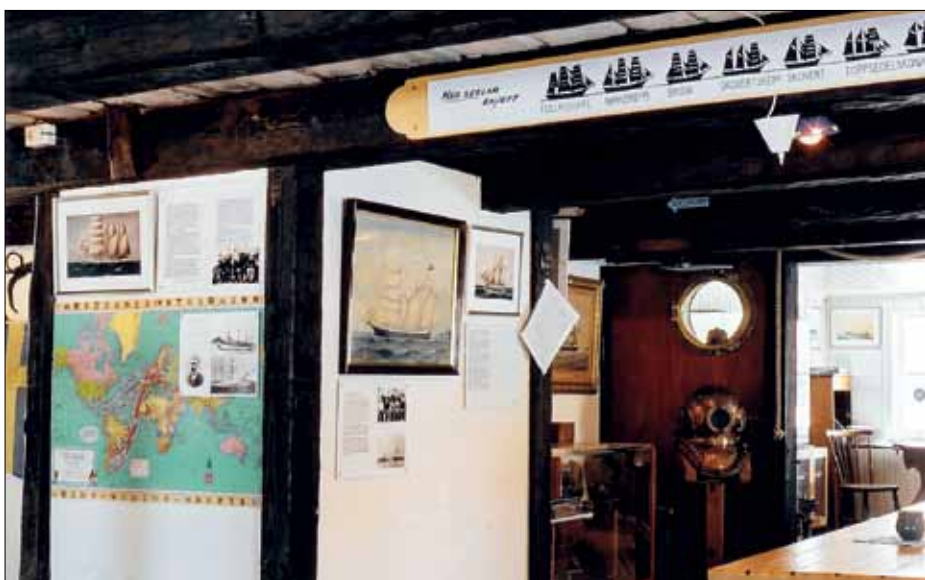
I Timmernabben finns en mycket fin samling lokal sjöfartshistoria.