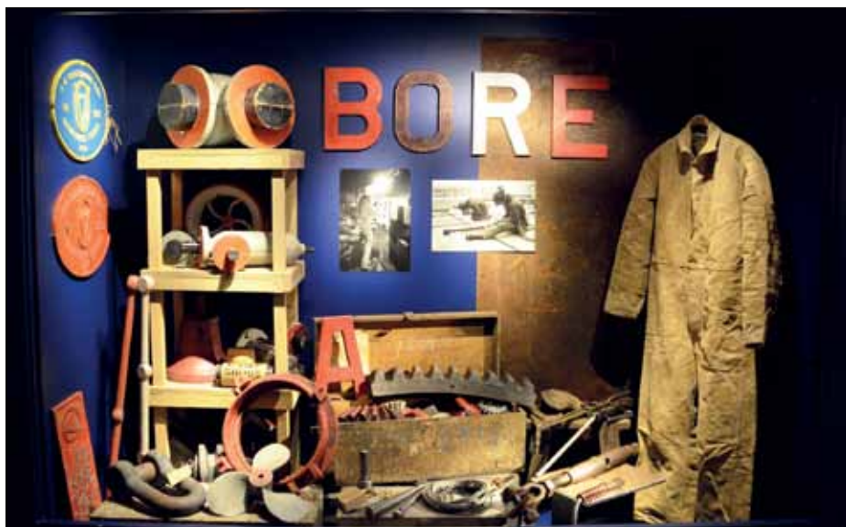
Interiör från varvsdelen av museet i Oskarshamn.

lokal sjöfartshistoria. I hamnen står briggen Sveas kajuta i restaurerat skick tillsammans med timmernabbenbyggda skonaren Astrids akterspegel.