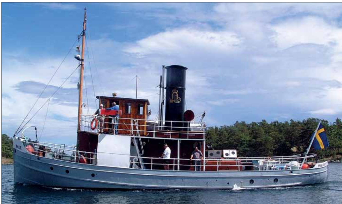
Bogserbåten Nalle ligger förtöjd i hamnen och den är naturligtvis K-märkt.