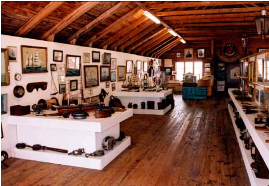
Det välfyllda sjöfartsmuseet i Bergkvara.