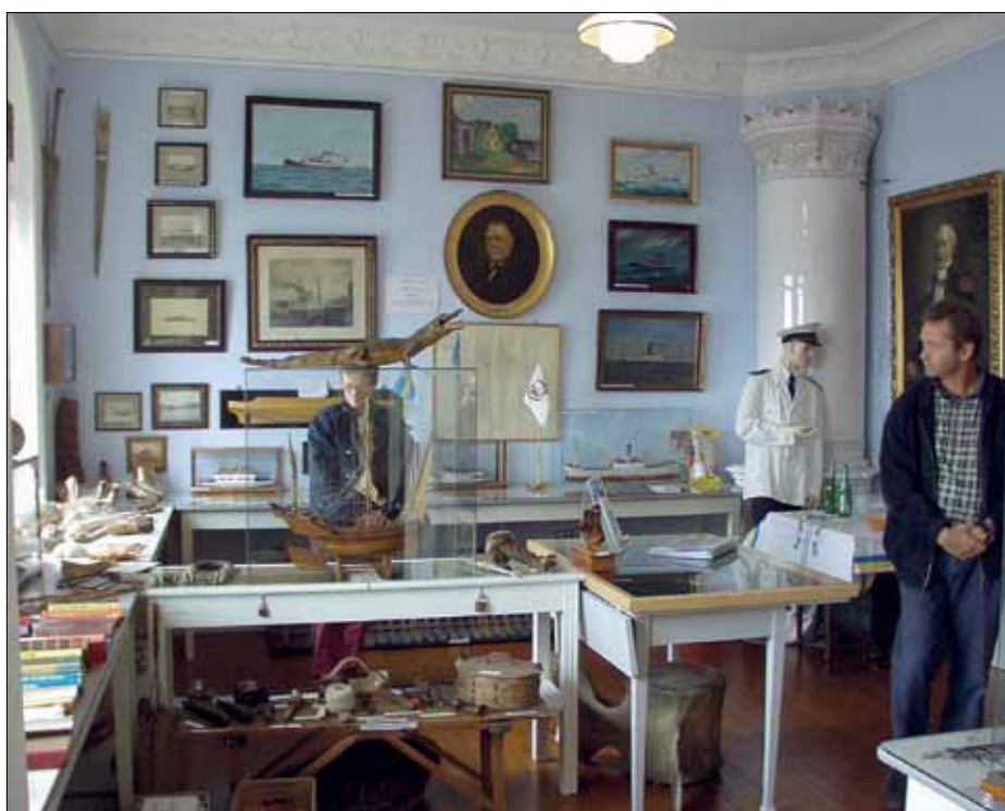
I Kalmar finns många sjöfartsmodeller och stora arkiv.