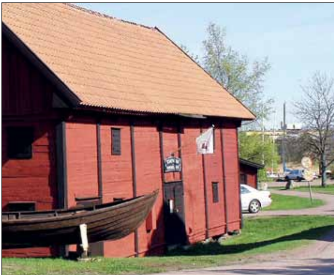
I det pittoreska hamn-magasinet i Figeholm finns sjöfartsmuseet inrymt.

finansiera den marknadsföring som krävs i dagens mediala marknadssamhälle. Därför beslöt man att år 2000 gå samman i en paraplyorganisation baserad på traditionellt svenskt föreningsarbete. Initiativet backades även upp av det då nybildade Regionförbundet i Kalmar län och Samverkansorganisationen Sjöfararkusten Småland-Öland var född.