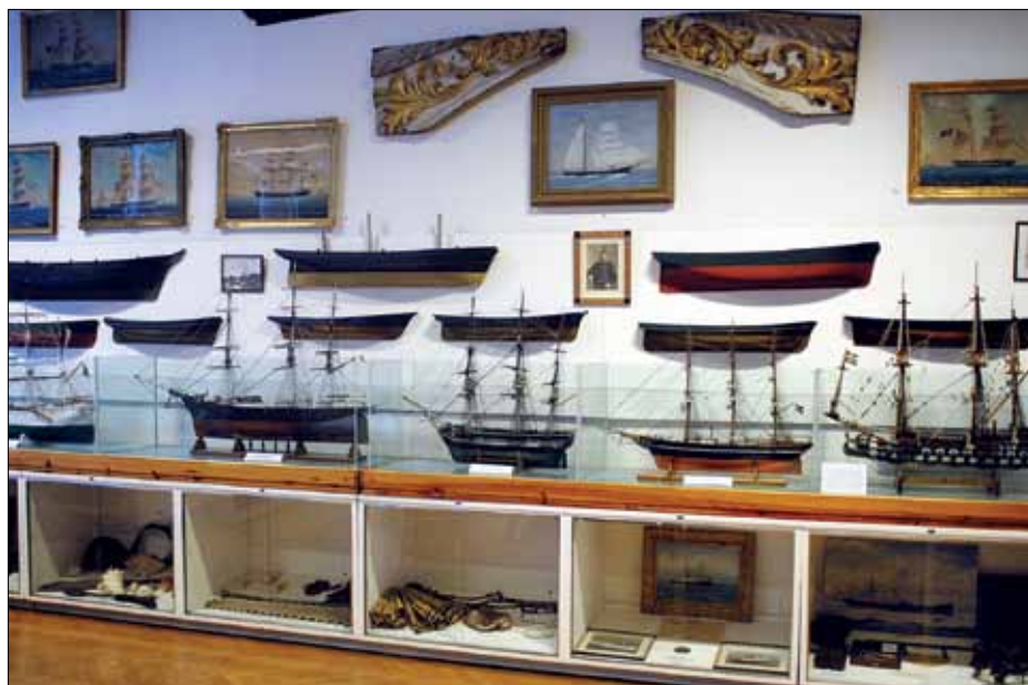
På museet i Västervik kan man beskåda en stor samling modeller av segelfartyg.